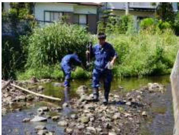
西沢での水質サンプル採取

施設の稼働に伴う周辺環境への影響について大気や水質など測定、さらに原子力発電所の事故に伴う影響を排ガス測定で検証するなど、各測定の結果は良好で安全・安心を確認しました【裏面】。また、地域住民の代表である環境運営委員会では測定の立ち会いや多様な議論などを通じ、良好な地域環境のための取り組みをしていただきました。