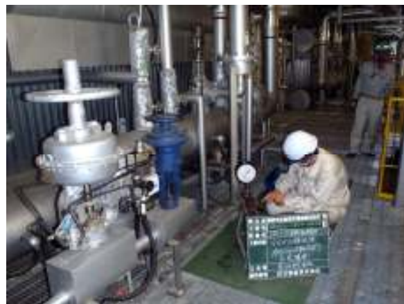
焼却を停止してのボイラー点検整備

施設の運転については焼却計画に基づき、実際のごみ搬入量などを考慮して細心の注意を払い実施。施設の維持管理は通常の保守点検に加え、焼却や発電に係る箇所を昨年10月に2週間停止し、総点検と修繕を行いました。このような取り組みによる安定した焼却の結果、再生可能エネルギーとして有効な高効率発電と順調な売電収入を確保しました。