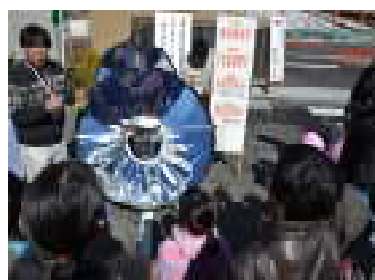
好評のソーラークッカー実演

めて「一周年記念見学会」を開催しました【写真】。普段とは異なる施設の見学や太陽光パネルを使ったイベントを行い、「学習や親子がふれあう良い機会」など参加者から好評を得ました。このように地域に根差した施設となるべく、年間を通して、多様な取り組みを行いました。